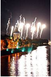
Festival des Arts de la Rue

http://www.libourne-tourisme.com/que-faire/les-rendez-vous-de-loffice-de-tourisme.html